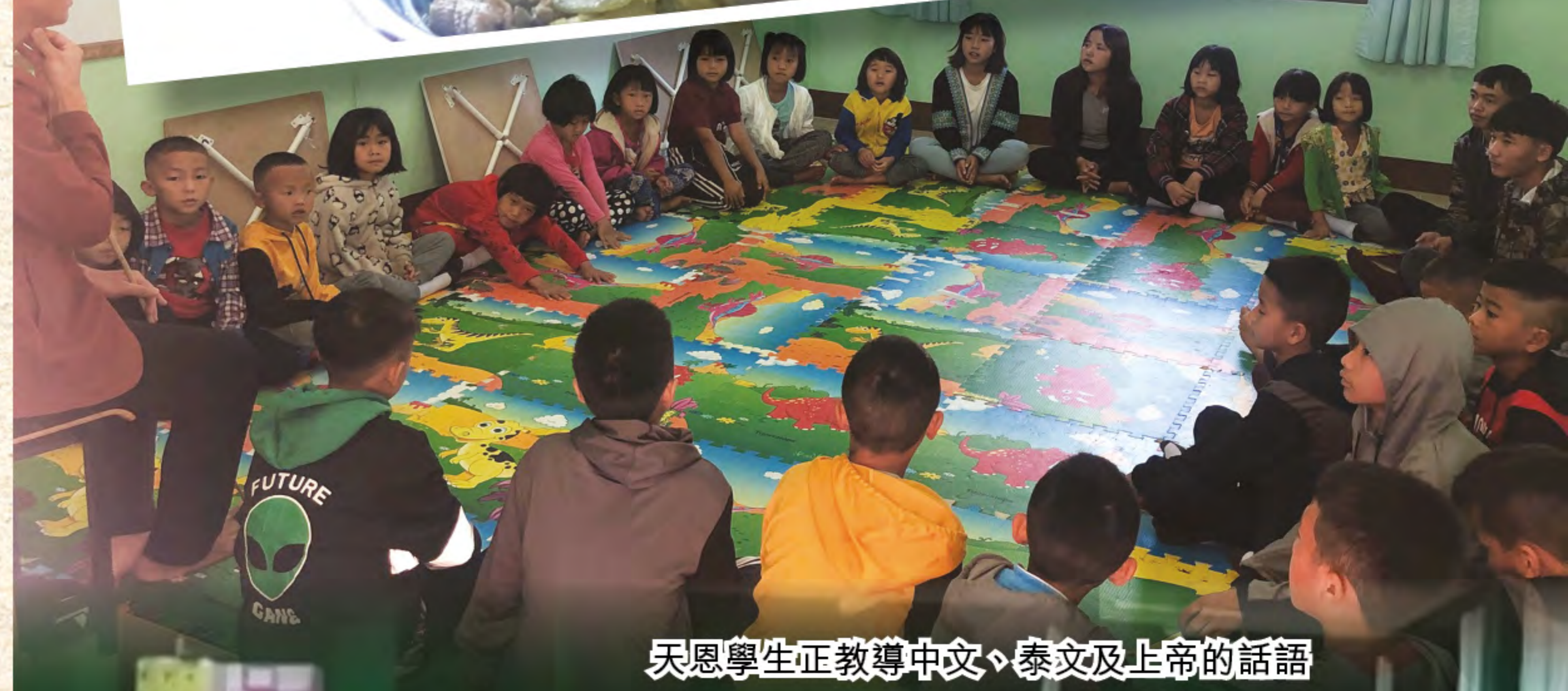
天恩學生正教導中文、泰文及上帝的話語